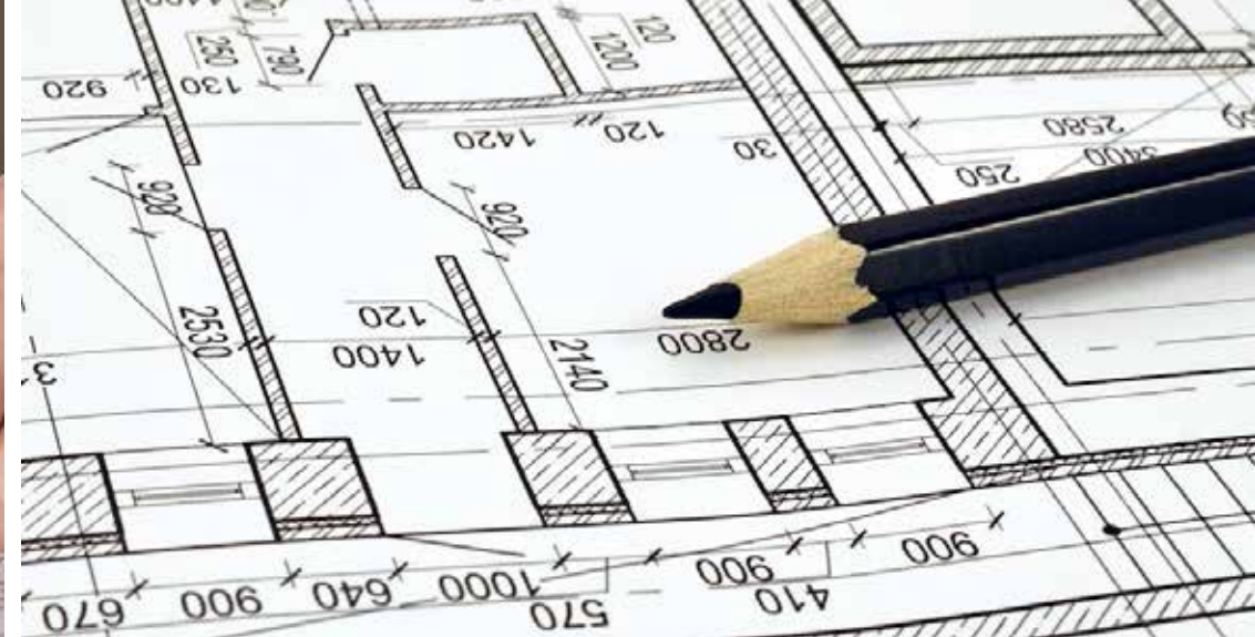
CONFECÇÃO DE PROJETOS ARQUITETÔNICOS, ESTRUTURAIS E DE INSTALAÇÕES