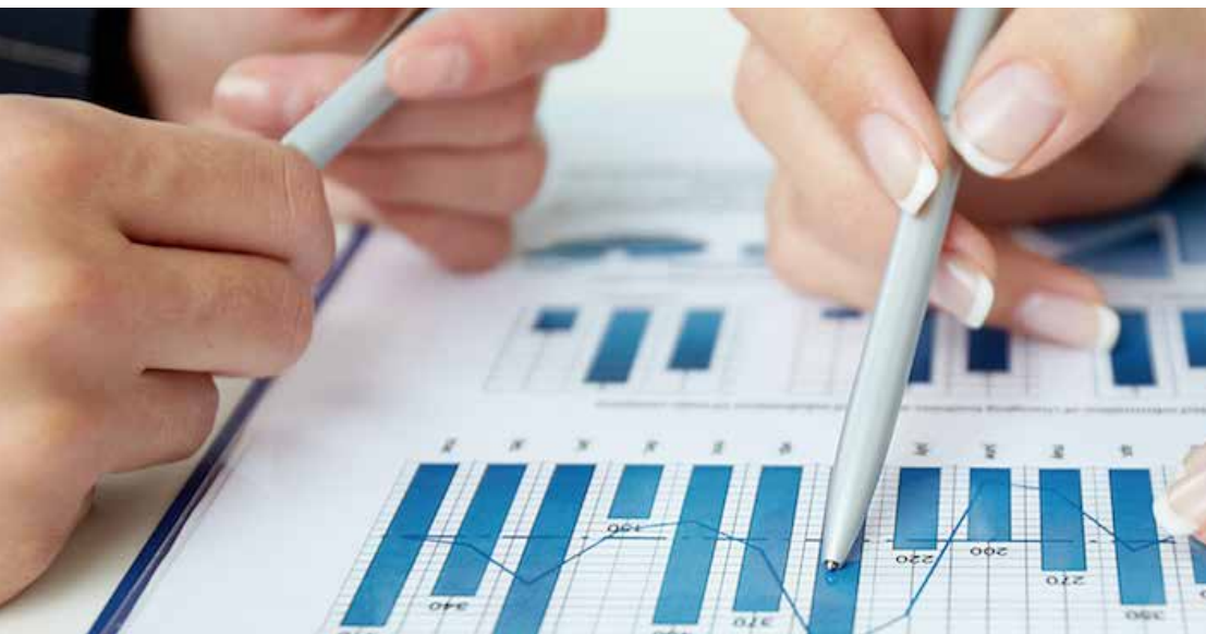
ESTUDO DE VIABILIDADE TÉCNICA CONSULTORIA EM REDUÇÃO DE CUSTOS OPERACIONAIS