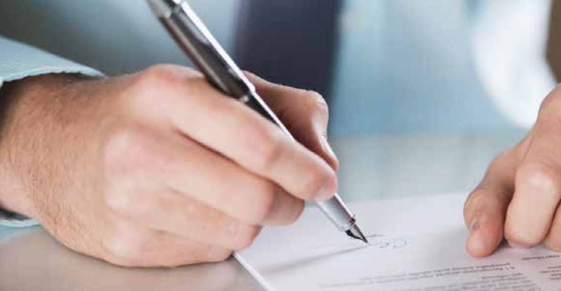
AVALIAÇÃO E PERÍCIA DE IMÓVEIS VISTORIA PARA RECEBIMENTO DE CONSTRUTORAS