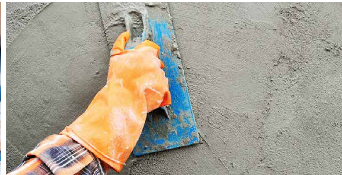
REFORMA DE IMÓVEIS E MANUTENÇÃO PREDIAL